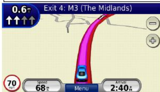
Navádění do pruhů a provozní informace