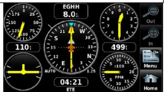
Přístrojový panel GPS