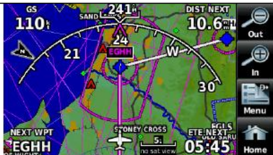
Letecká mapa s GPS navigací