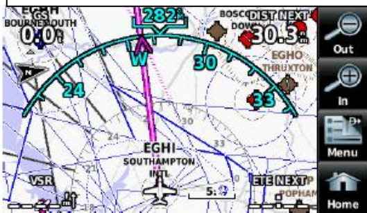
IFR Mapy s letovými cestami